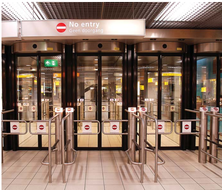
Flipflow Securitydeur; luchthaven Schiphol

Automatisch en veilig toegangssysteem voor gecontroleerd eenrichtingsverkeer van personen.